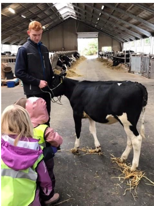
Besøg på Landbrugsskole